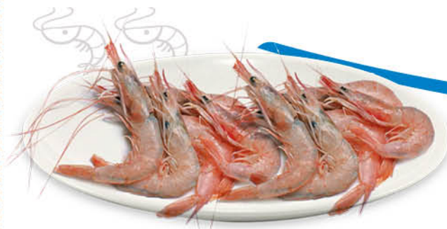
GAMBERI ROSA NAZIONALI