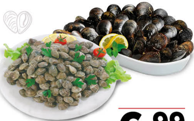
BIS FRUTTI DI MARE: 1 KG DI COZZE + 1 KG DI LUPINI