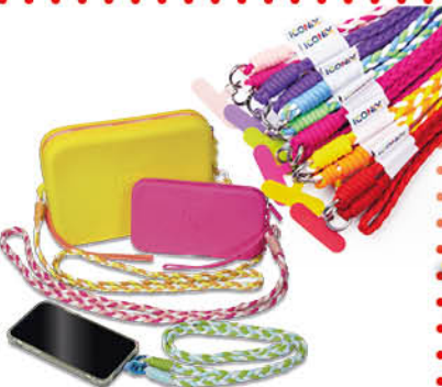
TRACCOLLA LAYNARD ICONIX