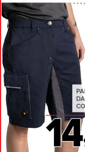
PANTALONE DA LAVORO CORTO