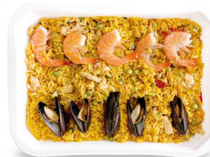
PAELLA ALLA VALENCIANA NEL REPARTO GASTRONOMIA