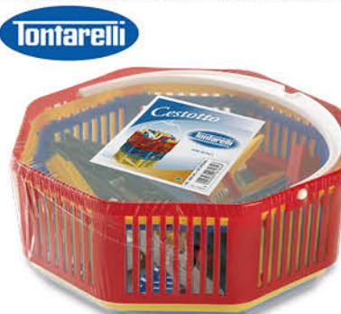
CESTOTTO CON 30 MOLLETTE