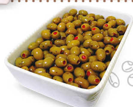
OLIVE GIGANTI FARCITE