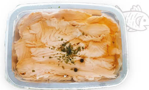
CARPACCIO DI SALMONE 200 g - 29,95 al kg