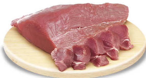
FILETTO DI TONNO DECONGELATO