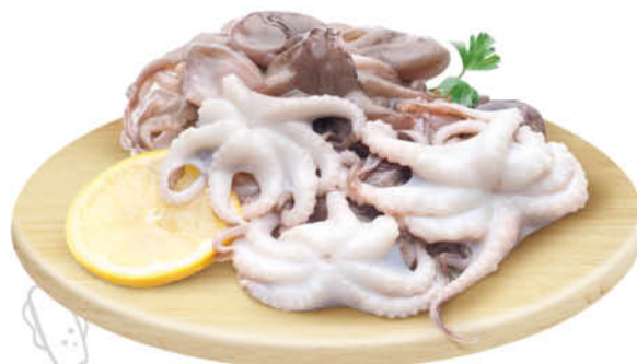
POLPO PICCOLO DECONGELATO