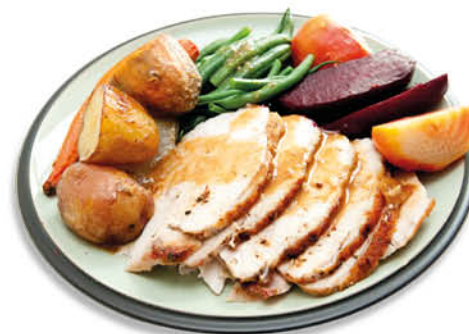
ARROSTO DI TACCHINO NEL REPARTO GASTRONOMIA