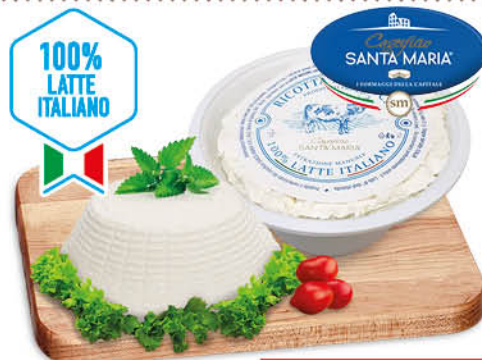
RICOTTA DI MUCCA