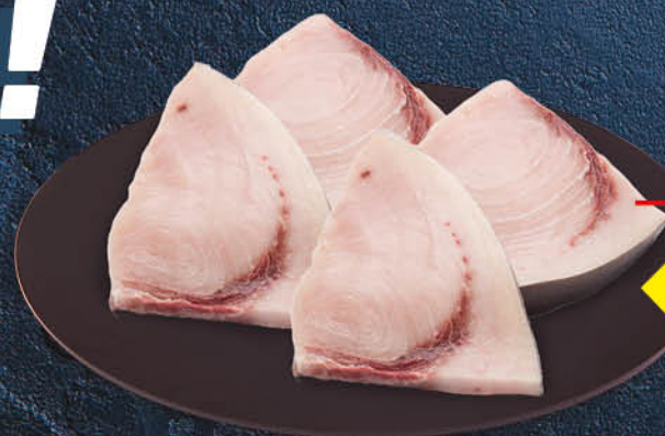
PESCE SPADA FRESCO A TRANCI