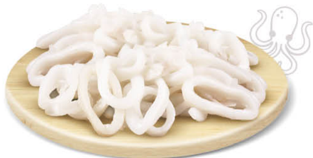
ANELLI DI TOTANO DECONGELATO