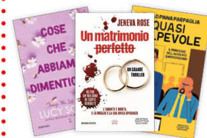
TASCABILE NEWTON COMPTON KING