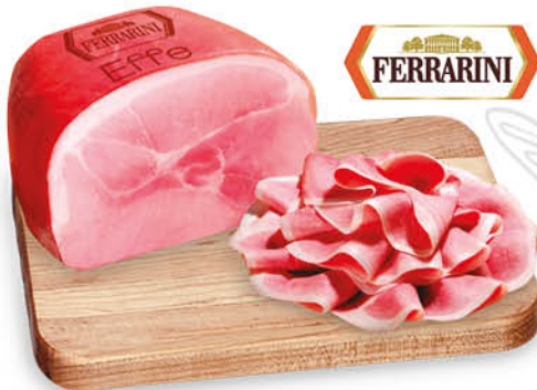
PROSCIUTTO COTTO ALTA QUALITÀ