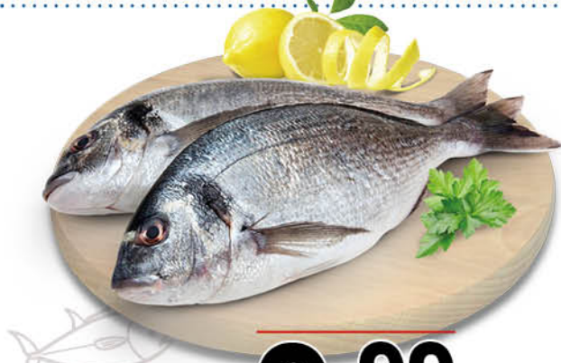
ORATE 300 - 500 g