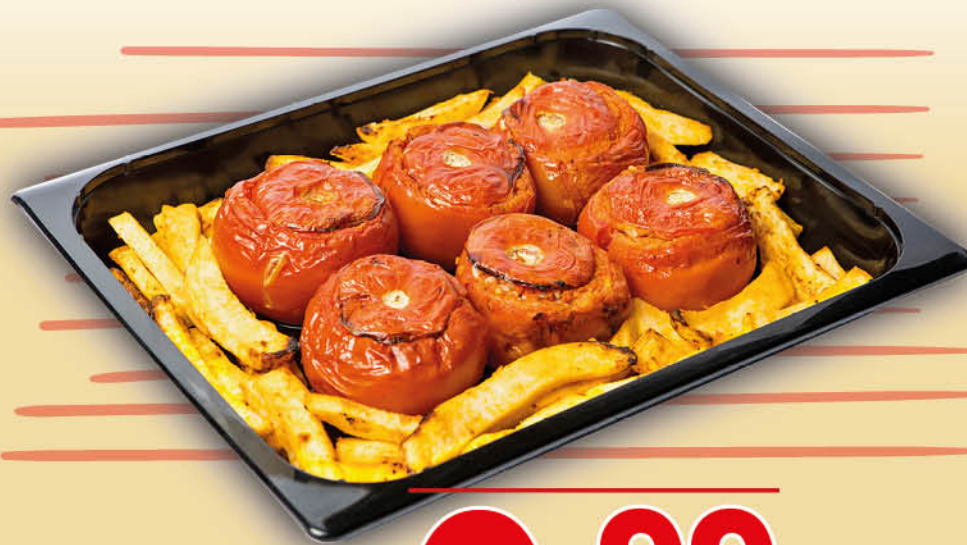
POMODORI DI RISO E PATATE NEL REPARTO GASTRONOMIA