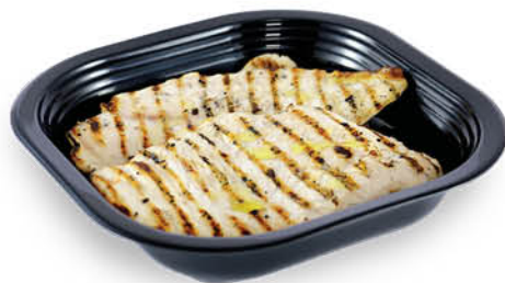
PETTO DI POLLO GRIGLIATO NEL REPARTO GASTRONOMIA