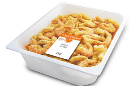
FRITTO MISTO MOLLUSCHI E CROSTACEI NEL REPARTO GASTRONOMIA