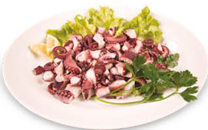
INSALATA DI POLPO CON PATATE NEL REPARTO GASTRONOMIA