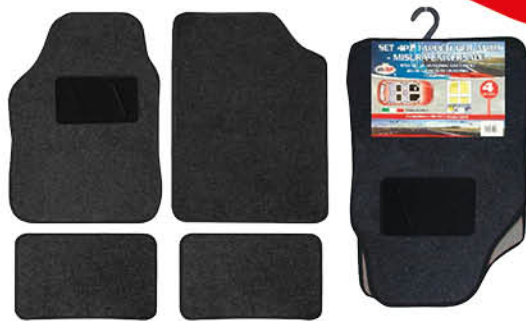
KIT TAPPETI AUTO IN MOQUETTE