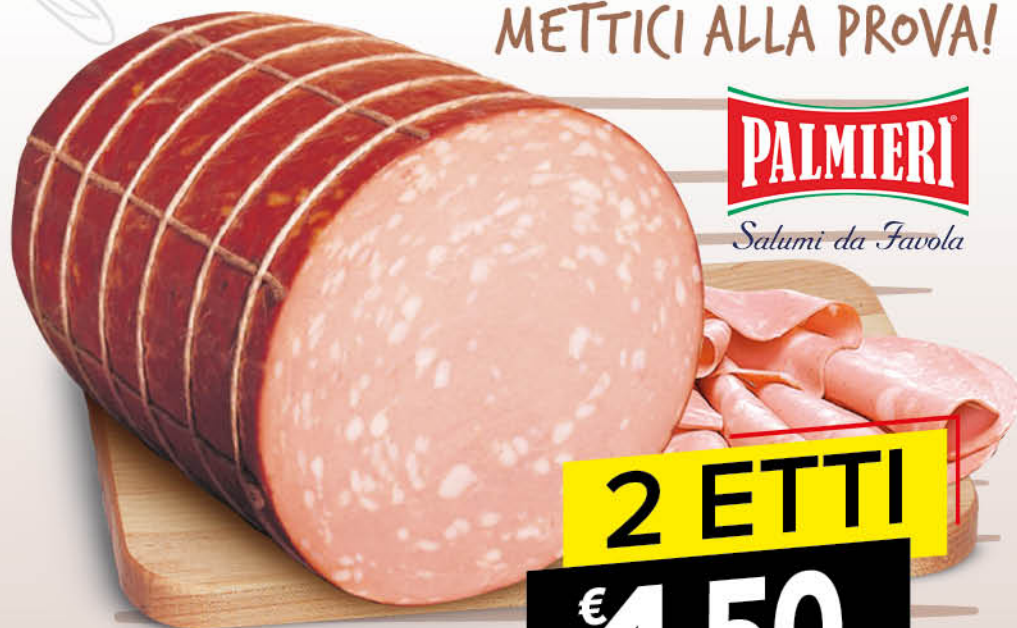
MORTADELLA - SENZA PISTACCHIO - CON PISTACCHIO