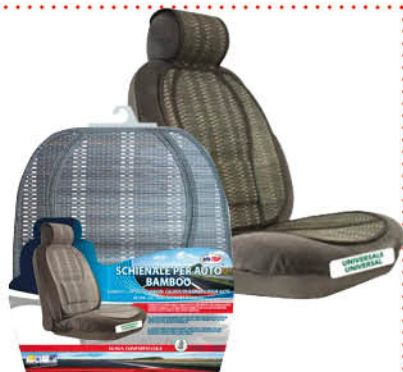
SCHIENALE AUTO BAMBOO - GRIGIO - NERO