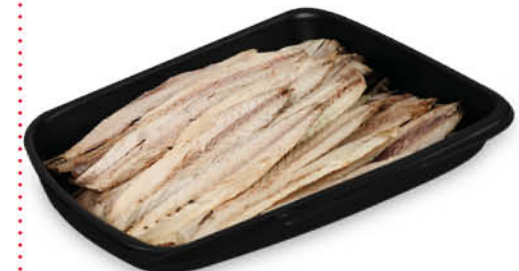
FILETTI DI SGOMBO MARINATI NEL REPARTO GASTRONOMIA