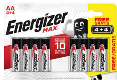
PILE ENERGIZER AA 4+4