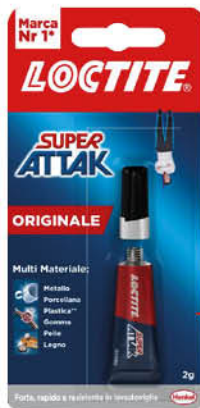
LOCTITE SUPER ATTACK 2GR