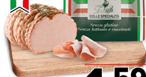
PETTO DI POLLO ARROSTO ITALIANO