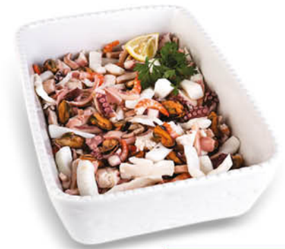
INSALATA DI MARE NEL REPARTO GASTRONOMIA