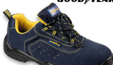
SCARPA ANTINFORTUNISTICA BASSA S1P ✓ Misure: 41/46