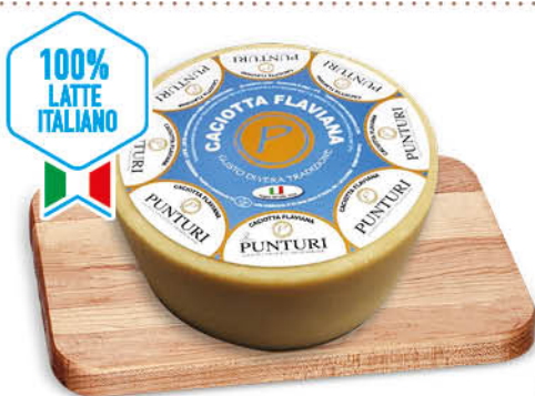
CACIOTTA MISTA FLAVIANA