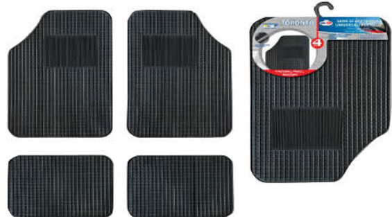
KIT TAPPETI AUTO IN GOMMA