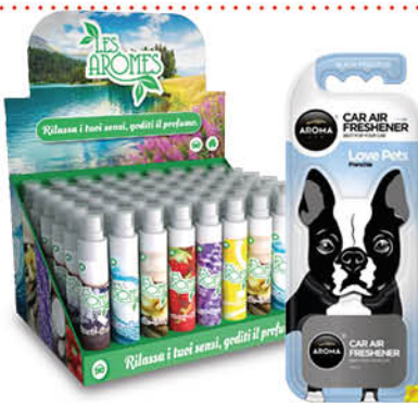
PROFUMATORI E DEODORANTI AUTO