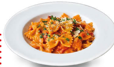
FARFALLE CON CREMA DI PEPERONI NEL REPARTO GASTRONOMIA