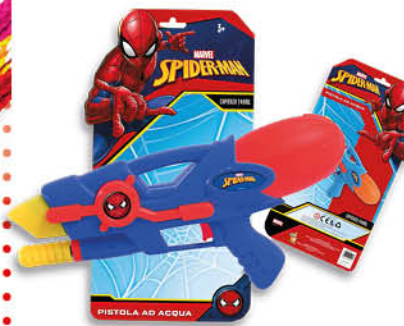
- PISTOLA SPARABOLLE - GIOCATTOLO MARE