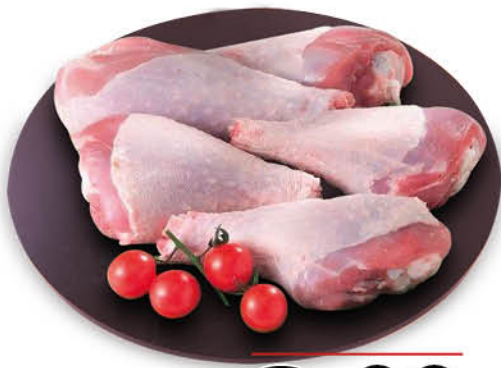
FUSI DI TACCHINO