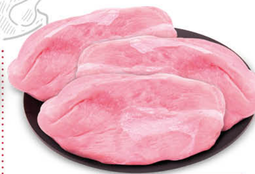
FESA A FETTE DI TACCHINO