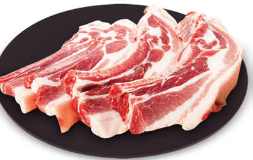
PANCETTA DI SUINO CON COSTINA