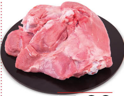
SOVRACOSCE DI TACCHINO