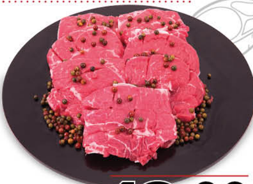
TAGLIATA DI BOVINO ADULTO