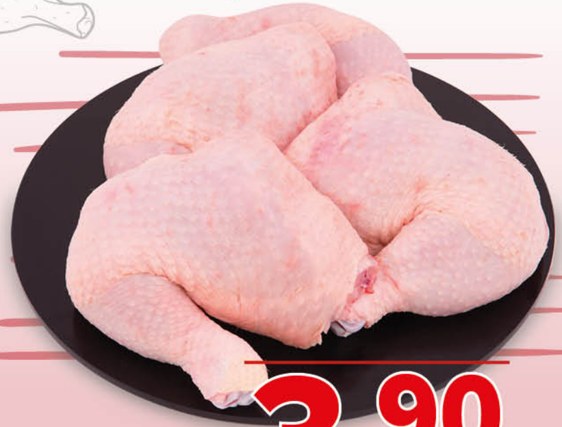
COSCIOTTO DI POLLO