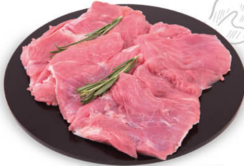
BISTECCA DI TACCHINO