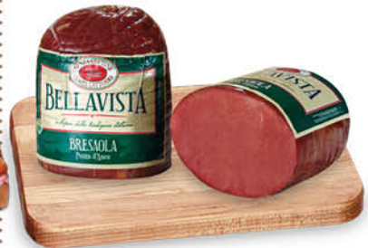
BRESAOLA PUNTA D'ANCA BELLA VISTA