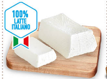
GIUNCATA PUGLIESE - CLASSICA - RUCOLA - SPIGA