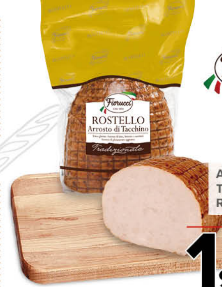
ARROSTATO DI TACCHINO ROSTELLO