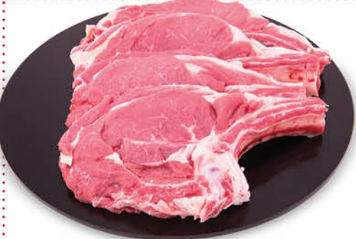
BISTECCA CON OSSO DI BOVINO ADULTO