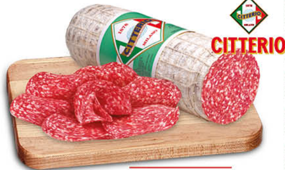
SALAME CITTERIO - MILANO - UNGHERESE