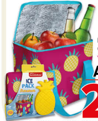
BORSA TERMICA CON SIBERINO ✓ Fantasie assortite