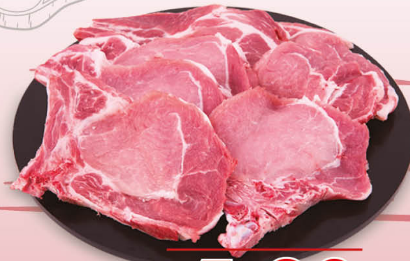
BRACIOLA DI LOMBO DI SUINO CON OSSO