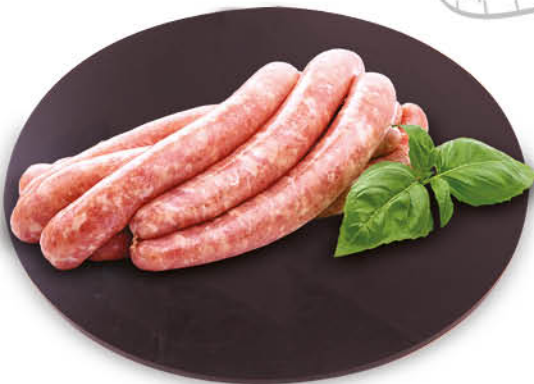
SALSICCIA DI POLLO 360 g - € 8,06 al kg