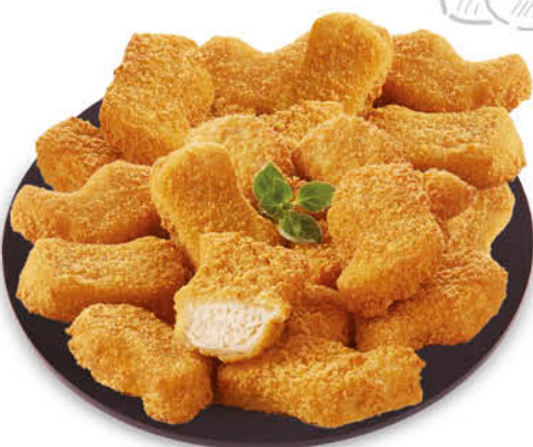
BOCCONCINI DI POLLO PANATI 270 g - € 9,23 al kg