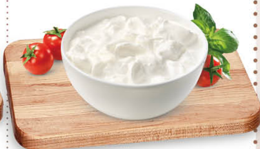
STRACCIATELLA PROMO VALIDA SOLO PV ADERENTI