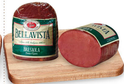
BRESAOLA PUNTA D'ANCA BELLA VISTA