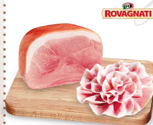
PROSCIUTTO COTTO ALTA QUALITÀ GRAN BISCOTTO DELICATO