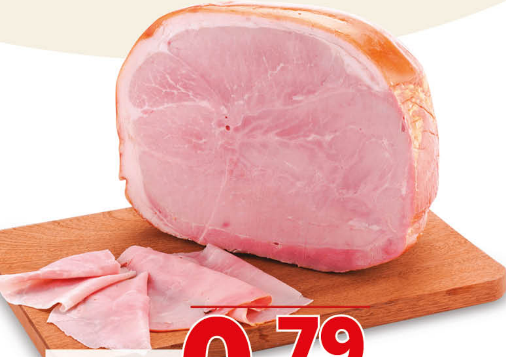
PROSCIUTTO COTTO DOMINO NEL REPARTO GASTRONOMIA