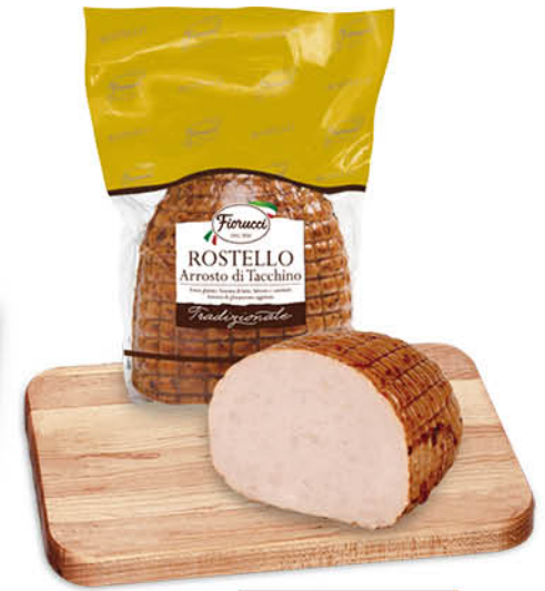
ARROSTO DI TACCHINO ROSTELLO