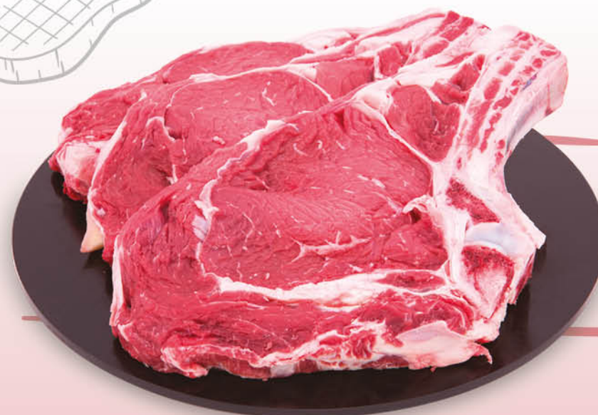
COSTATA DI BOVINO ADULTO SOLO PER PDV CON LAVORAZIONE REPARTO CARNI