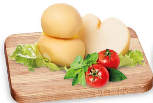
SCAMORZE PASSITE PROMO VALIDA SOLO PV ADERENTI