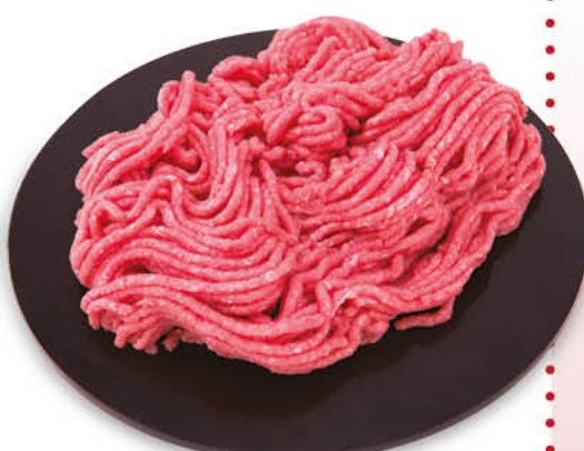
MACINATO MISTO BOVINO/SUINO