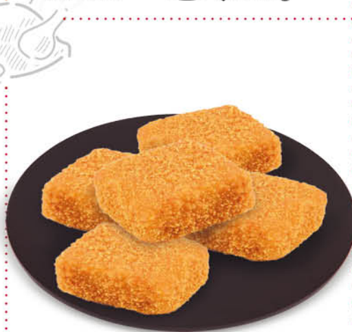
AQUILONI DI POLLO CON SPINACI E FORMAGGIO 360 g - € 10,84 al kg