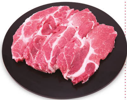
FETTINE DI COLLO DI SUINO SENZ'OSSO