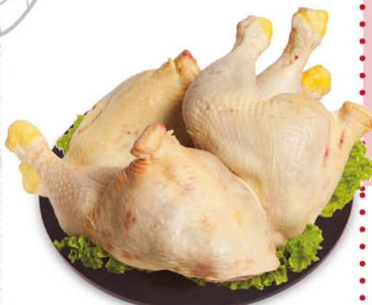
POSTERIORE DI POLLO