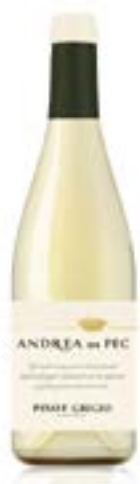
Pinot Grigio Andrea Di Pec D.O.C.