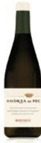
Refosco dal Peduncolo Rosso Andrea Di Pec I.G.T.

Paglierino luminoso. All'olfatto ricorda gelsomino, mughetto, pesca bianca, melone invernale acerbo, sensazioni di erba limoncella e caramella al limone. Sorso equilibrato, sostenuto da una spina dorsale fresco-sapida, con ritorni agrumati e vegetali, chiude con un respiro balsamico.