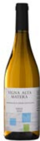
Vigna Alta Matera Greco D.O.C.

Rubino con sfumature porpora. Naso vinoso, ricorda l'amarena, le prugne mature, accenni di violette, pepe nero, toni di rabarbaro, erbe amare, inchiostro e sensazioni cioccolatose. Sorso sferico, avvolgente, moderatamente tannico, con un finale di cioccolato, china e liquirizia.