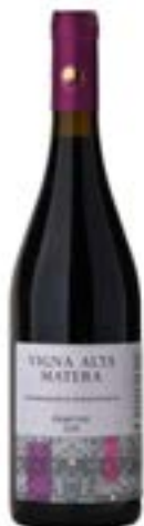
Vigna Alta Matera Primitivo D.O.P.

Nate nel 1950 Cantine Taverna hanno saputo mantenere il carattere di originalità che conferisce unicità ai suoi prodotti. Si tratta di un'azienda a conduzione familiare, giunta alla terza generazione, con sede a Nova Siri, dedita non solo alla produzione vinicola, ma anche a quella agricola e zootecnica. Dal 2017 è stata realizzata una linea senza l'aggiunta di solfiti.