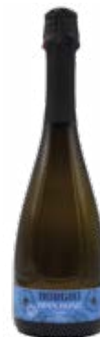
Cuveé Brut Applauso BLANC DE BLANCS

Fa parte di un vero e proprio gruppo, costituito da quattro realtà, Paladin e Bosco del Merlo in Veneto, Castello Bonomi in Franciacorta e Castelvechi in Chianti, con conduzione rigidamente familiare. La filosofia produttiva è incentrata su una "viticoltura ragionata", con un approccio scientifico-ecologico alla gestione della vigna, al fine di preservare la biodiversità del territorio. Tale approccio è reso possibile anche grazie alla collaborazione con le Università di Padova e Milano, che hanno portato negli ultimi anni alla realizzazione di progetti di sostenibilità che rappresentano un fiore all'occhiello aziendale.