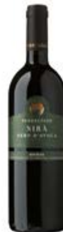
Terreliade Nirà D.O.C.

Terreliade rappresenta l'anima mediterranea del Gruppo Vinicolo Santa Margherita. I vigneti sorgono fra macchie di mandorli e uliveti, su terreni di matrice argillosa, in un clima asciutto, caratterizzato da importanti sbalzi termici tra giorno e notte, che donano ai vini profumi unici ed eleganti. Viene riposta grande attenzione nelle tecniche colturali, nella potatura, nel diradamento manuale e nella scelta dei vitigni, privilegiando gli autoctoni, come Nero d'Avola, Inzolia e Grillo. In cantina le scelte tecnologiche guardano al futuro: una sorta di cattedrale dove i sistemi di vinificazione più aggiornati si accompagnano alla tranquilla lentezza dell'affinamento in botte.