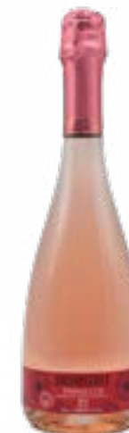
Rosè Brut Prosecco D.O.C. MILLESIMATO