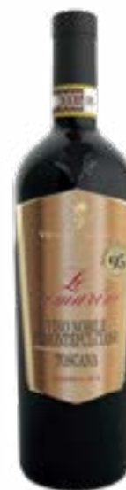
Vino Nobile di Montepulciano Le Camarine Riserva

Realtà cooperativa dai grandi numeri e dalla grande qualità, la Vecchia Cantina di Montepulciano nacque nel 1937 per mano di quattro soci fondatori. Oggi vanta 400 proprietari e 1000 ettari vitati. Fu la prima cooperativa toscana del dopoguerra ad assumere un ruolo fondamentale di volano per il territorio. In cantina si avvale della preziosa collaborazione/direzione di Umberto Tormbelli, enologo-consulente espertissimo, che si trova a dirigere una produzione variegata e rappresentativa del terroir zonale, grazie all'eterogeneità di appezzamenti che variano per altitudine e composizione del suolo.