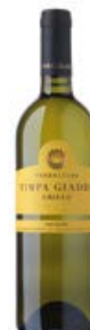
Terreliade Timpa Giadda D.O.C.