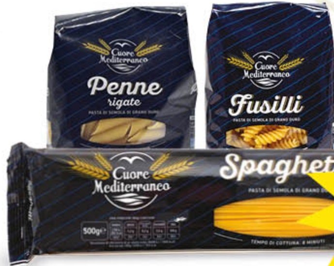
PASTA DI SEMOLA DI GRANO DURO VARI FORMATI 500 g - € 0,67 al kg