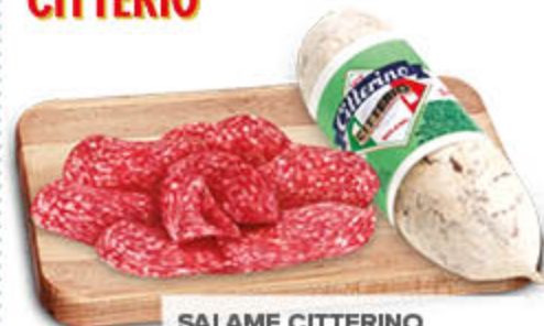
SALAME CITTERINO CITTERIO NEL REPARTO GASTRONOMIA