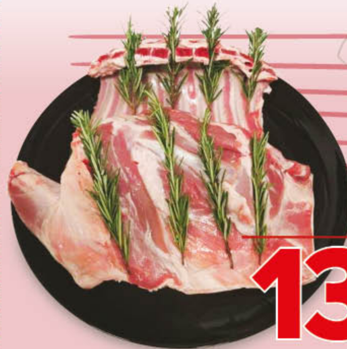
AGNELLO IN PARTI