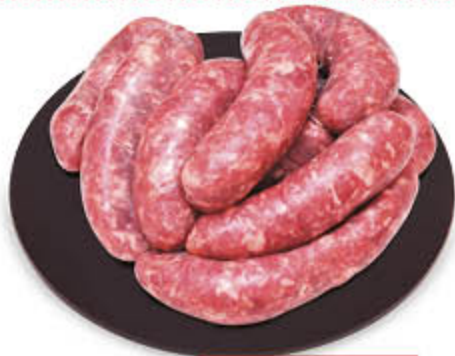
SALSICCE DI SUINO