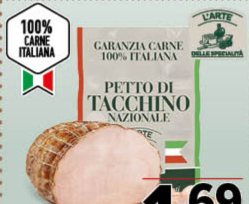
PETTO DI TACCHINO NAZIONALE