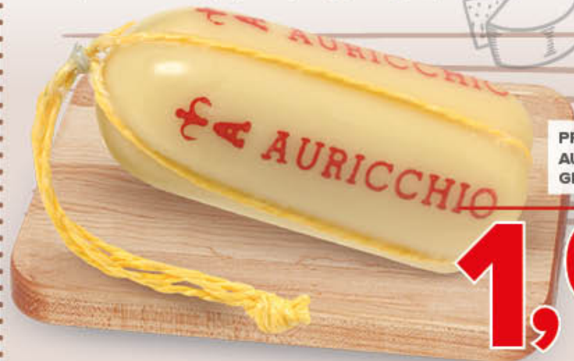
PROVOLONE AURICCHIO GIOVANE