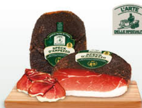
SPECK D'AMPEZZO ALTO DI FESA