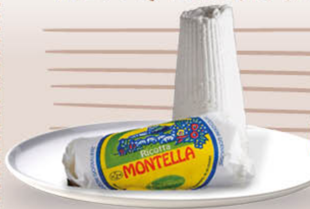
RICOTTA FRESCA MONTELLA