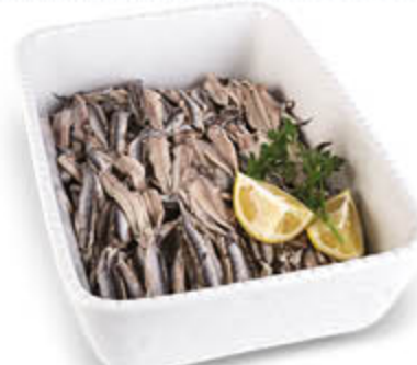
FILETTI DI ALICI MARINATI