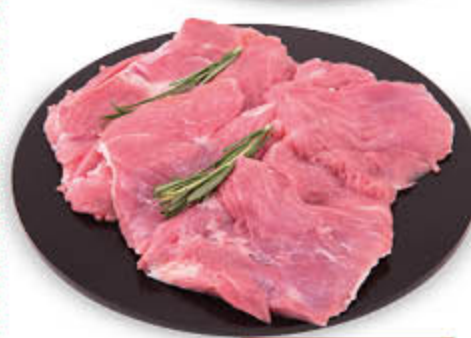
BISTECCHINE DI TACCHINO