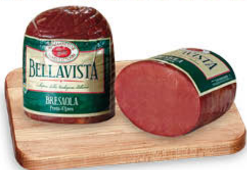
BRESAOLA PUNTA D'ANCA BELLA VISTA