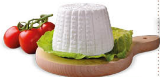
RICOTTA DI PECORA LA FONTE