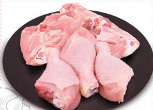
FUSI/ SOVRACOSCE DI POLLO