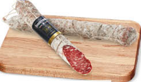
SALAME FELINO IGP NEL REPARTO GASTRONOMIA