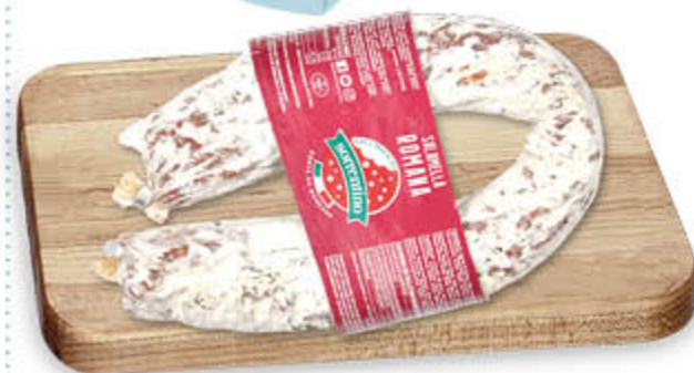
SALAMELLA ALLA ROMANA NEL REPARTO GASTRONOMIA