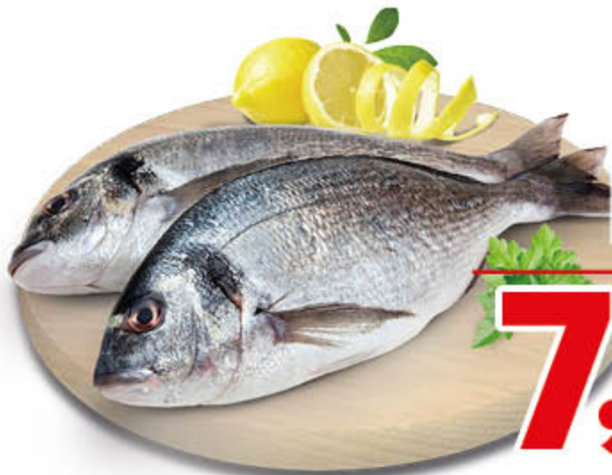
ORATA 300 - 500 g