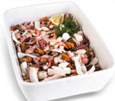
INSALATA DI MARE