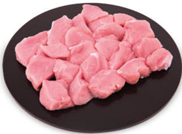
BOCCONCINI DI SUINO