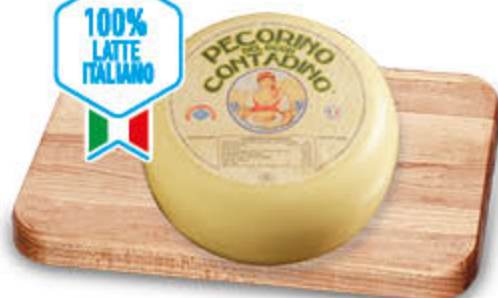
PECORINO DEL BUON CONTADINO