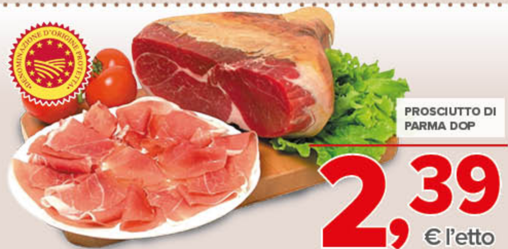
PROSCIUTTO DI PARMA DOP