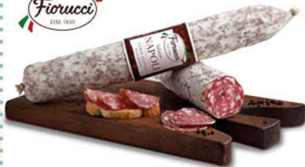
SALAME NAPOLI FIORUCCI NEL REPARTO GASTRONOMIA