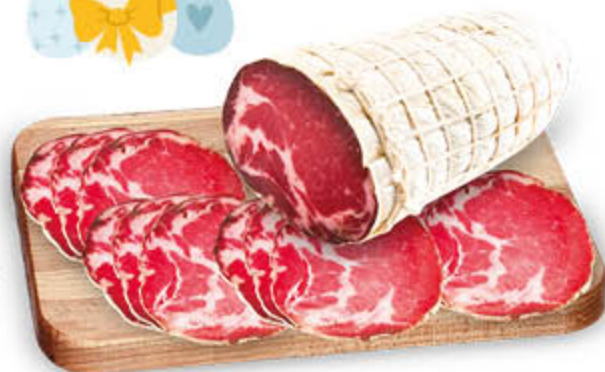
CAPOCOLLO STAGIONATO NEL REPARTO GASTRONOMIA