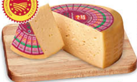
ASIAGO PRESSATO DOP