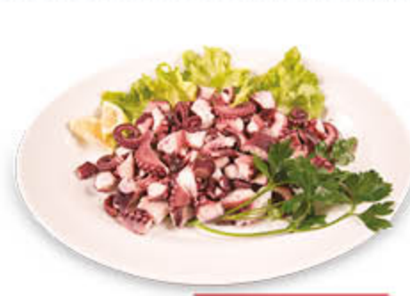
INSALATA DI POLPO CON PATATE