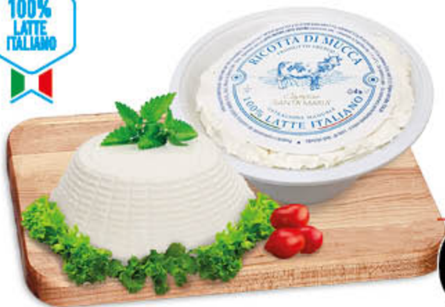
RICOTTA DI MUCCA