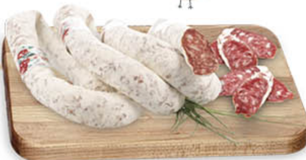
SALAME TORCIGLIONE NEL REPARTO GASTRONOMIA