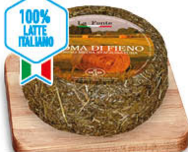
PECORINO AROMA DI FIEÑO STAGIONATO 90 GIORNI