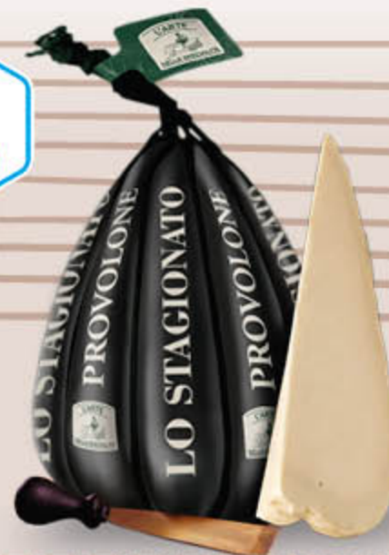
PROVOLONE PICCANTE MANDARONE "LO STAGIONATO"