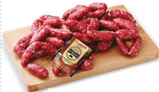
SALSICCIA STAGIONATA NEL REPARTO GASTRONOMIA