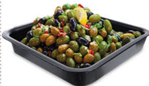
COCKTAIL DI OLIVE