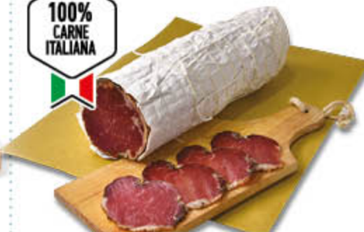
LONZINO STAGIONATO NEL REPARTO GASTRONOMIA