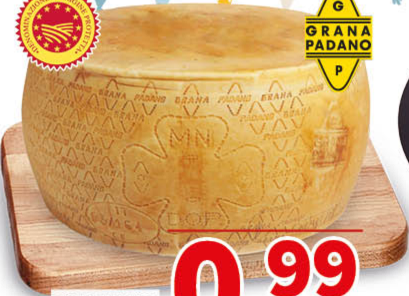
GRANA PADANO DOP SCELTO