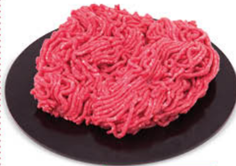
MACINATO MISTO DI BOVINO E SUINO