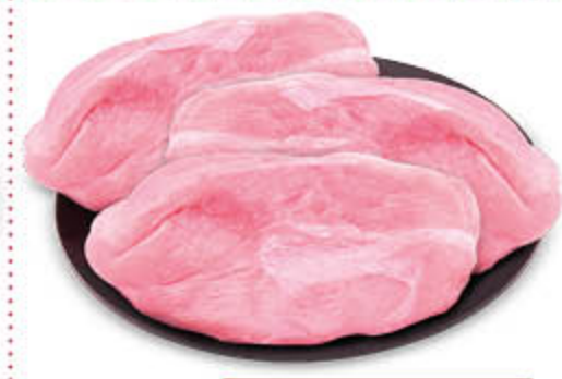
FESA A FETTE DI TACCHINO