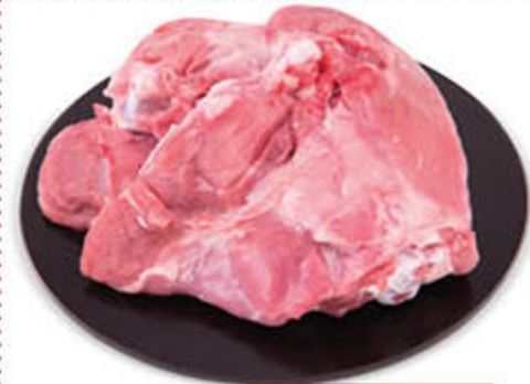
SOVRACOSCIA DI TACCHINO