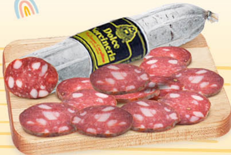
SALAME CORALLINA NEL REPARTO GASTRONOMIA