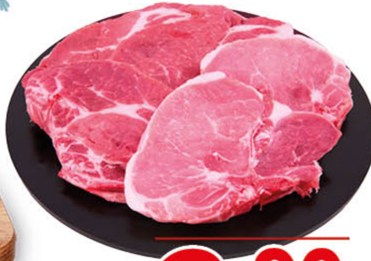
BRACIOLA MISTA DI SUINO