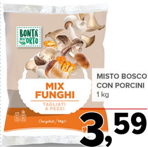
MISTO BOSCO CON PORCINI 1 kg