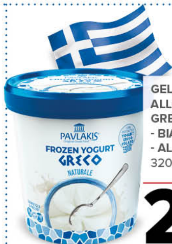
GELATO ALLO YOGURT GRECO - BIANCO - AL MIELE 320 g - € 8,41 al kg