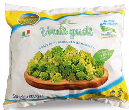
BROCCOLO ROMANESCO 600 g - € 3,32 al kg