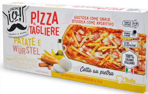
PIZZA TAGLIERE PATATE E WÜRSTEL 240 g - € 10,79 al kg