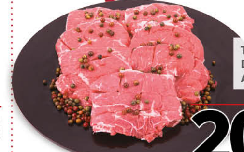
TAGLIATA DI BOVINO ADULTO DANESE