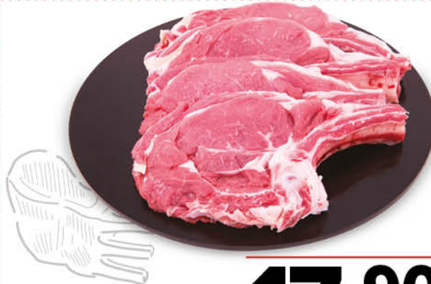
BISTECCA CON OSSO DI BOVINO ADULTO