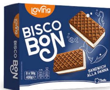
8 SANDWICH ALLA PANNA 400 g - € 6,48 al kg