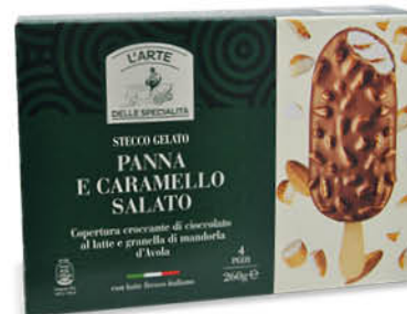
4 STECCHI - CARAMELLO SALATO E CIOCCOLATO - PISTACCHIO E CIOCCOLATO BIANCO 260 g