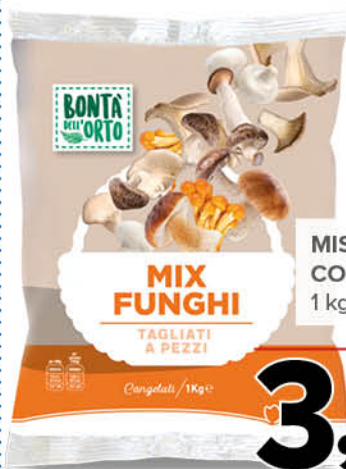
MISTO BOSCO CON PORCINI 1 kg