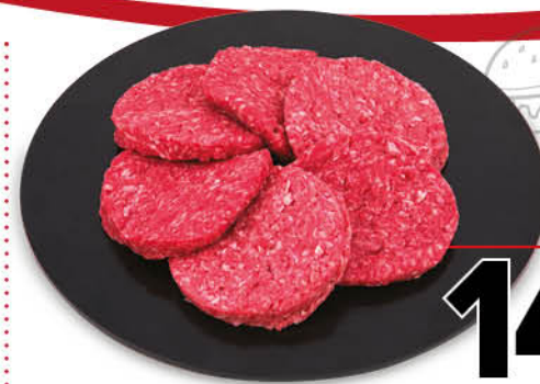
HAMBURGER DI BOVINO ADULTO