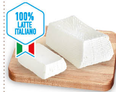
GIUNCATA PUGLIESE - CLASSICA - RUCOLA - SPIGA