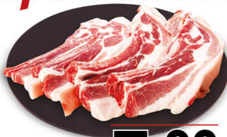
PANCETTA CON COSTINA