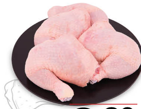
COSCIOTTO DI POLLO