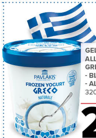
GELATO ALLO YOGURT GRECO - BIANCO - AL MIELE 320 g - € 8,41 al kg