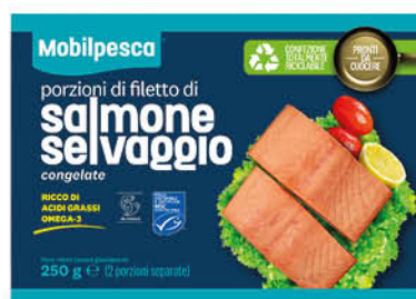
FILETTI DI SALMONE SELVAGGIO 250 g - € 14,36 al kg