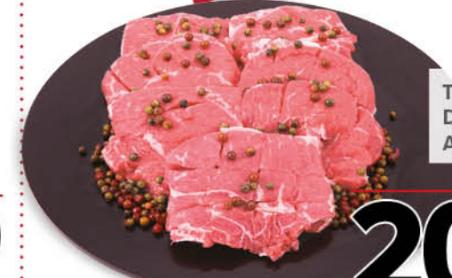
TAGLIATA DI BOVINO ADULTO DANESE