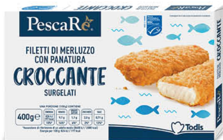
FILETTI DI MERLUZZO CROCCANTE 400 g - € 8,23 al kg