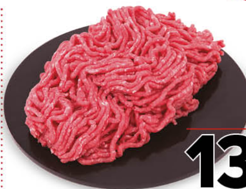
MACINATO SCELTO DI BOVINO ADULTO