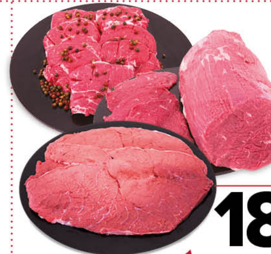
- TAGLIATA - FETTINE SCELTISSIME - FETTINE DI GIRELLO DI BOVINO ADULTO