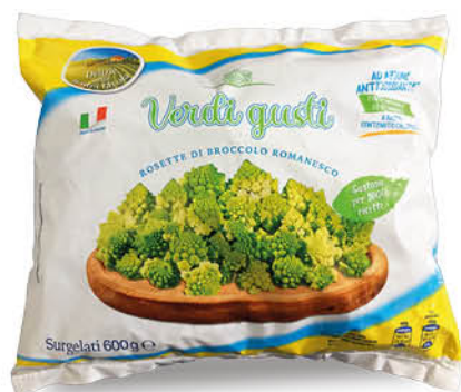
BROCCOLO ROMANESCO 600 g - € 3,32 al kg