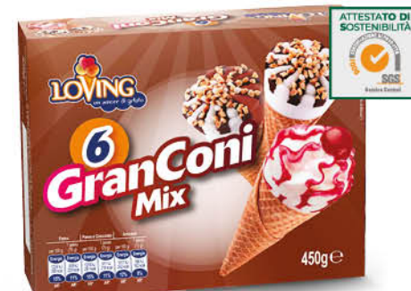
6 GRAN CONI MIX 450 g - € 7,53 al kg