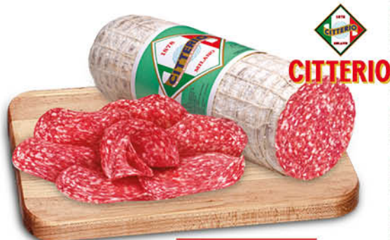
SALAME CITTERIO - MILANO - UNGHERESE