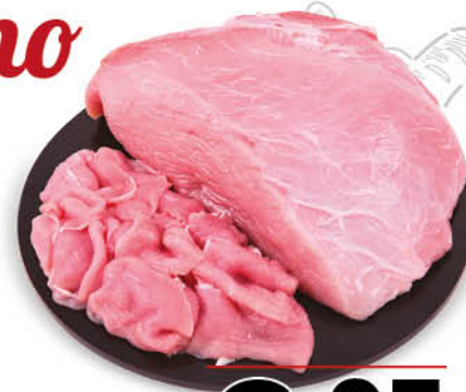
STRACCETTI DI SUINO