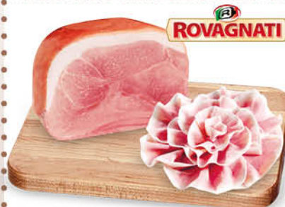
PROSCIUTTO COTTO ALTA QUALITÀ GRAN BISCOTTO DELICATO