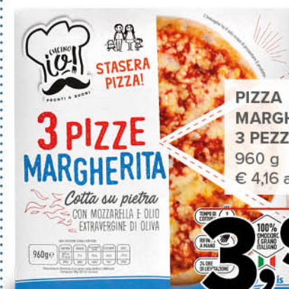
PIZZA MARGHERITA 3 PEZZI 960 g € 4,16 al kg