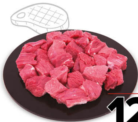
BOCCONCINI DI BOVINO ADULTO