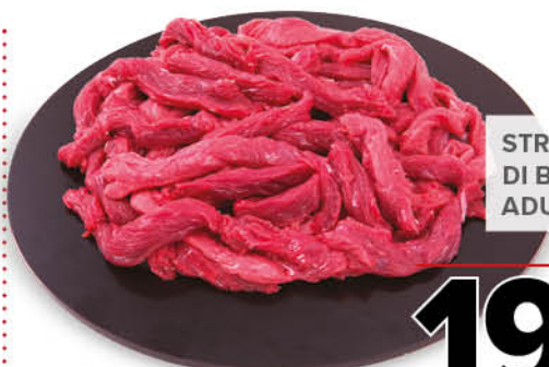
STRACCETTI DI BOVINO ADULTO DANESE