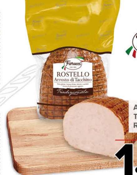
ARROSTO DI TACCHINO ROSTELLO