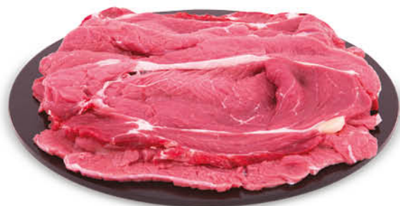
FETTINE PER GRIGLIA DI BOVINO ADULTO