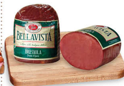
BRESAOLA PUNTA D'ANCA BELLA VISTA