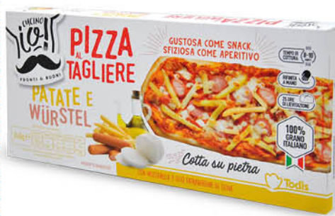
PIZZA TAGLIERE PATATE E WURSTEL 240 g - € 10,79 al kg