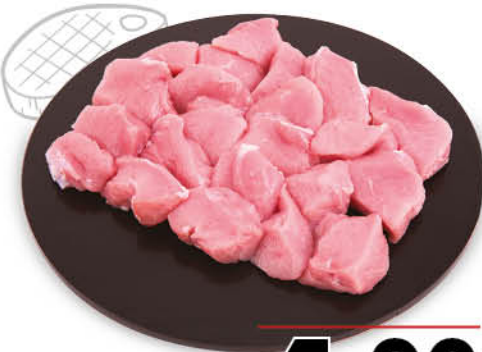
BOCCONCINI DI SUINO