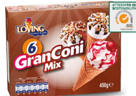
6 GRAN CONI MIX 450 g - € 7,53 al kg