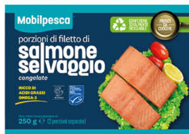
FILETTI DI SALMONE SELVAGGIO 250 g - € 14,36 al kg