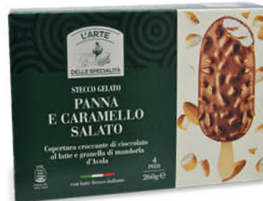
4 STECCHI - CARAMELLO SALATO E CIOCCOLATO - PISTACCHIO E CIOCCOLATO BIANCO 260 g