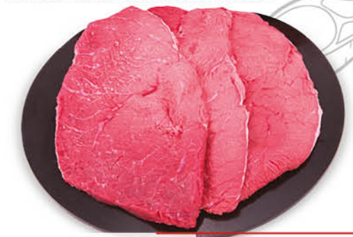
FETTINE SCELTISSIME DI BOVINO ADULTO SCOTTONA