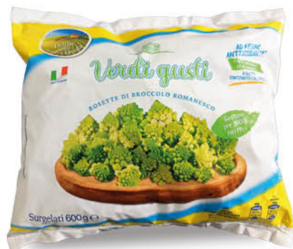
BROCCOLO ROMANESCO 600 g - € 3,32 al kg