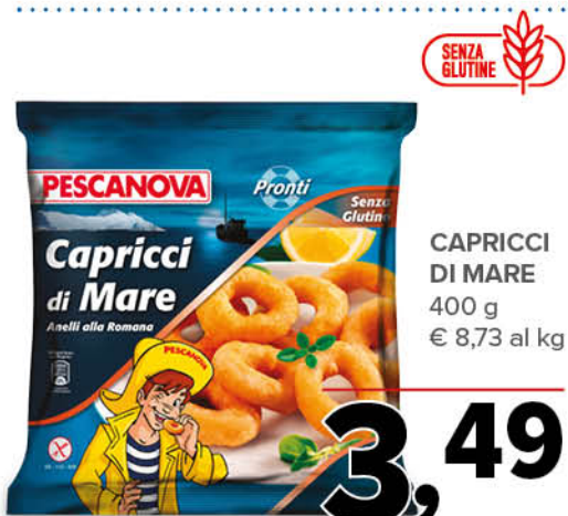
CAPRICCI DI MARE 400 g € 8,73 al kg