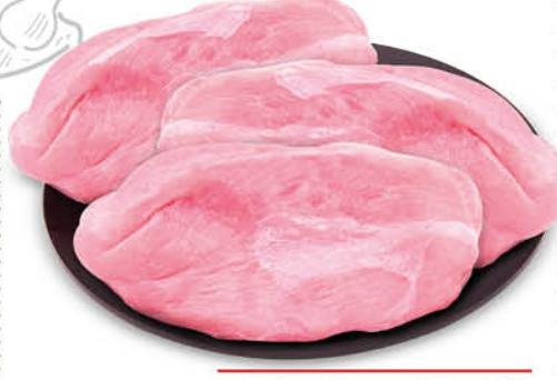
FESA A FETTE DI TACCHINO