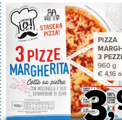
PIZZA MARGHERITA 3 PEZZI 960 g € 4,16 al kg