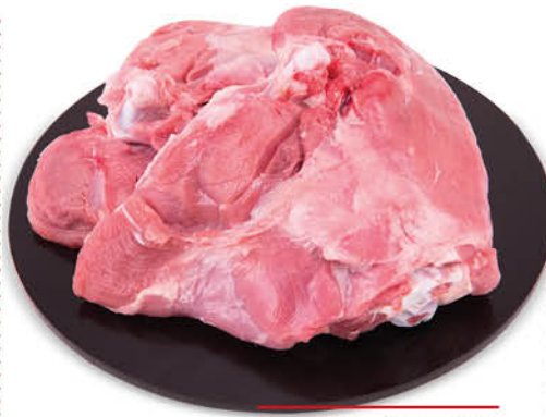
SOVRACOSCE DI TACCHINO