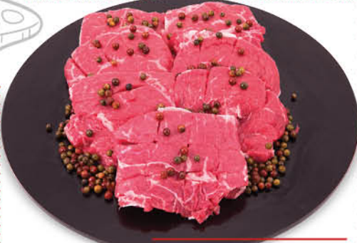
TAGLIATA DI BOVINO ADULTO