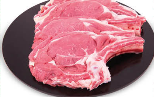
BISTECCA CON OSSO DI BOVINO ADULTO