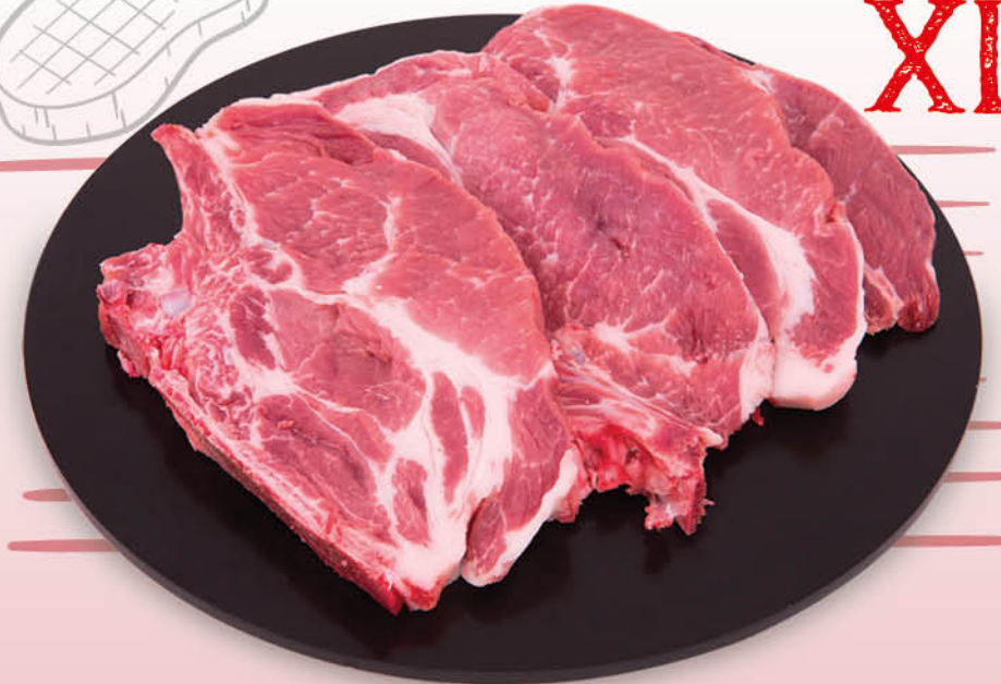
BRACIOLA DI COLLO DI SUINO CON OSSO XL