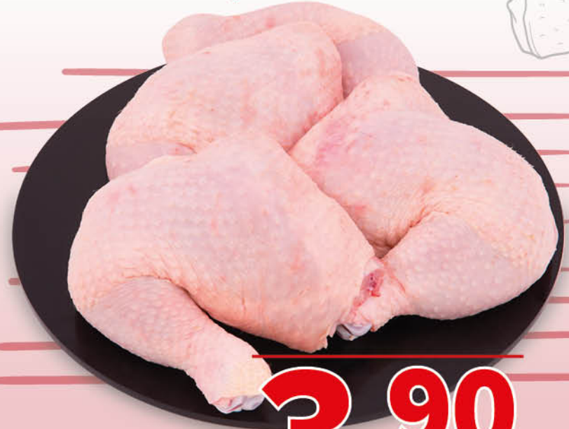
COSCIOTTO DI POLLO