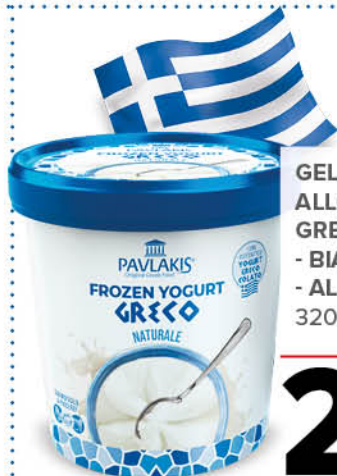
GELATO ALLO YOGURT GRECO - BIANCO - AL MIELE 320 g - € 8,41 al kg