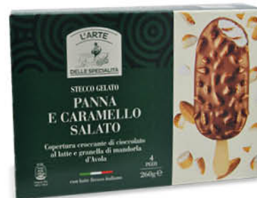
4 STECCHI - CARAMELLO SALATO E CIOCCOLATO - PISTACCHIO E CIOCCOLATO BIANCO 260 g