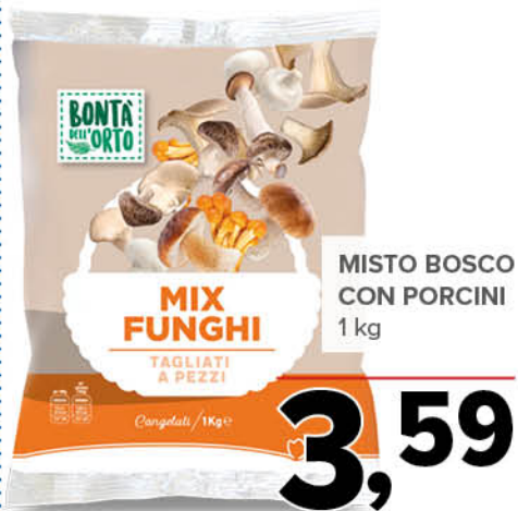
MISTO BOSCO CON PORCINI 1 kg