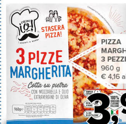
PIZZA MARGHERITA 3 PEZZI 960 g € 4,16 al kg