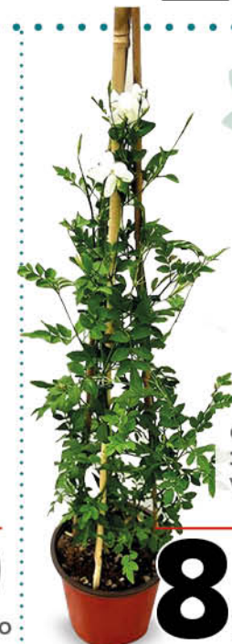
GELSOMINO 3 CANNE VASO 19 CM