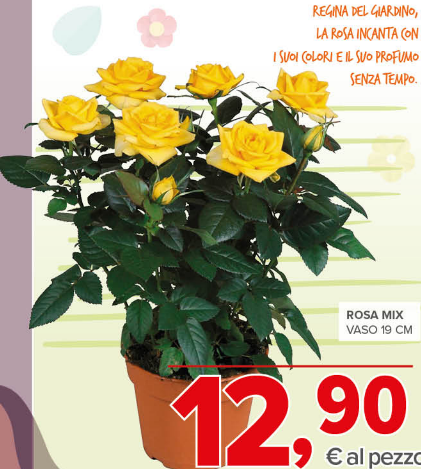
REGINA DEL GIARDINO, LA ROSA INCANTA CON I SUOI COLORI E IL SUO PROFUMO SENZA TEMPO.