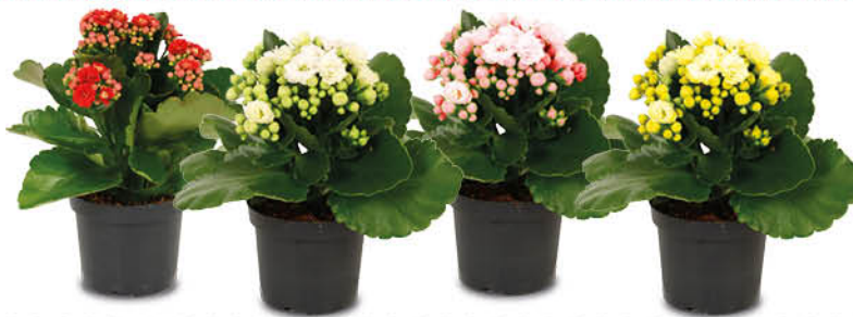
PIANTA KALANCOLA CALANDIVA VASO 12 CM