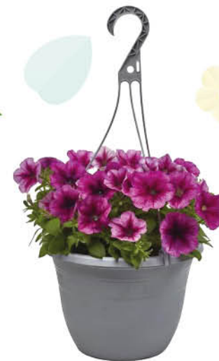
PIANTE FIORITE MIX BASKET VASO 19 CM