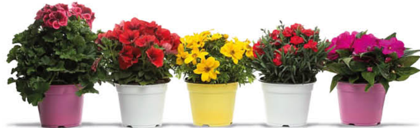
PIANTE FIORITE MIX VASO 14 CM