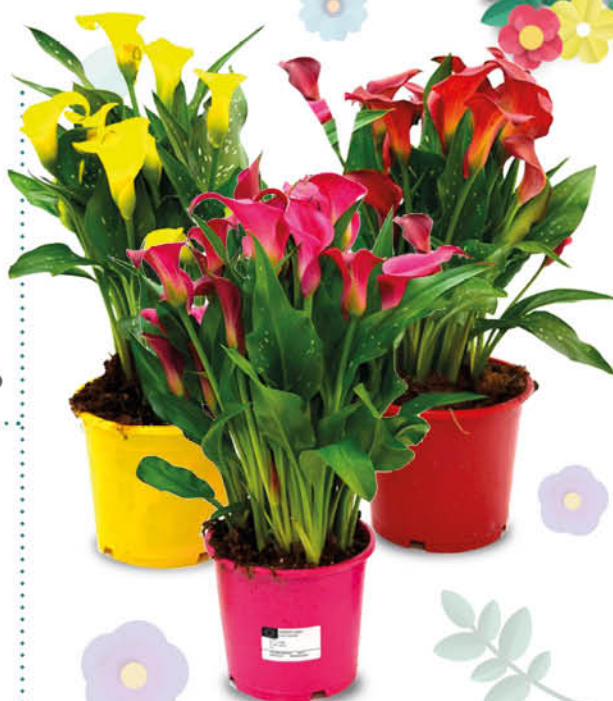
PIANTA CALLA MIX VASO 13 CM