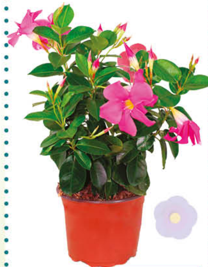
DIPLADENIA VASO 14 CM