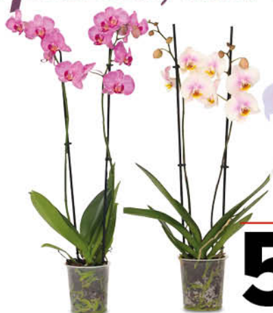
ORCHIDEA PHALENOPSIS MINI VASO 9 CM