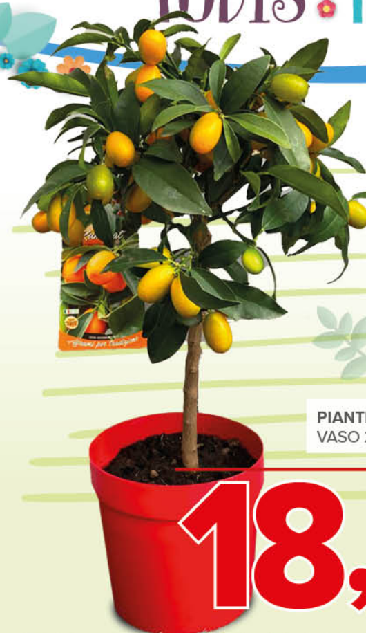
PIANTE DI AGRUMI MIX VASO 20 CM