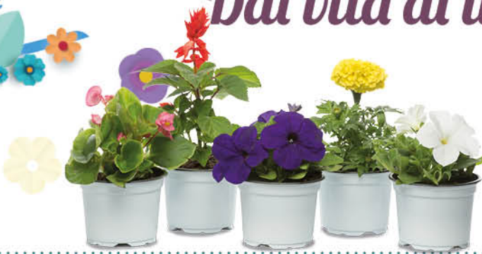
PIANTE STAGIONALI VASO 10 CM