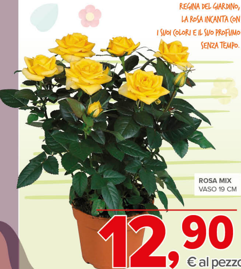
REGINA DEL GIARDINO, LA ROSA INCANTA CON I SUOI COLORI E IL SUO PROFUMO SENZA TEMPO.