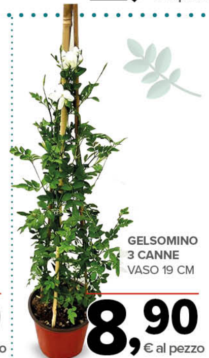
GELSOMINO 3 CANNE VASO 19 CM