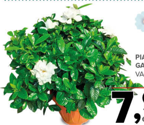
PIANTA GARDENIA VASO 17 CM