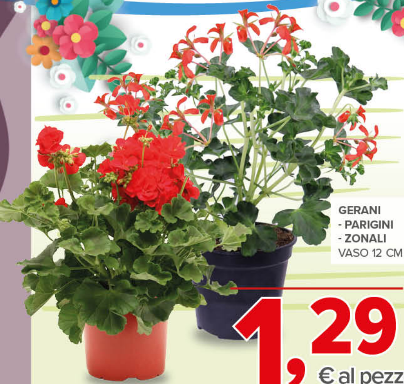
GERANI - PARIGINI - ZONALI VASO 12 CM