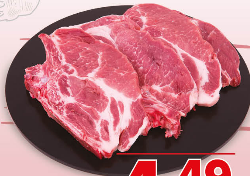
BRACIOLA DI COLLO DI SUINO CON OSSO