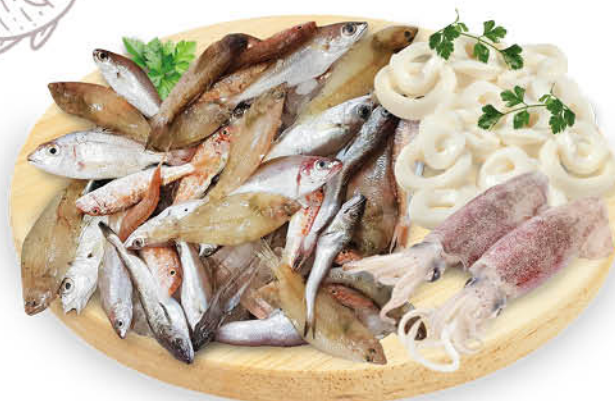
PREPARATO PER FRITTURA