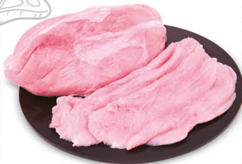
FESA DI TACCHINO A FETTE