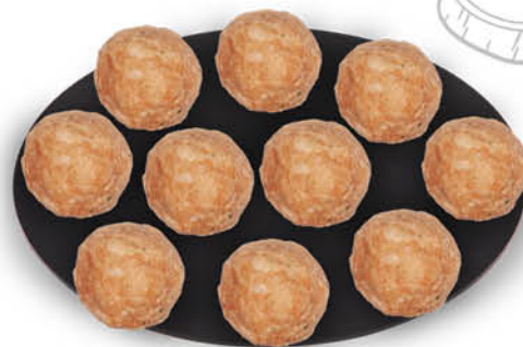
POLPETTINE DI POLLO E TACCHINO 240 g - € 12,42 al kg