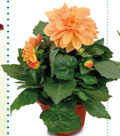
DALIA MIX COLORI VASO 14 CM