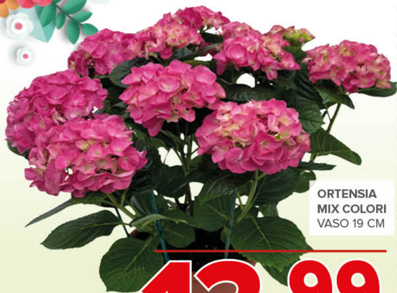
ORTENSIA MIX COLORI VASO 19 CM