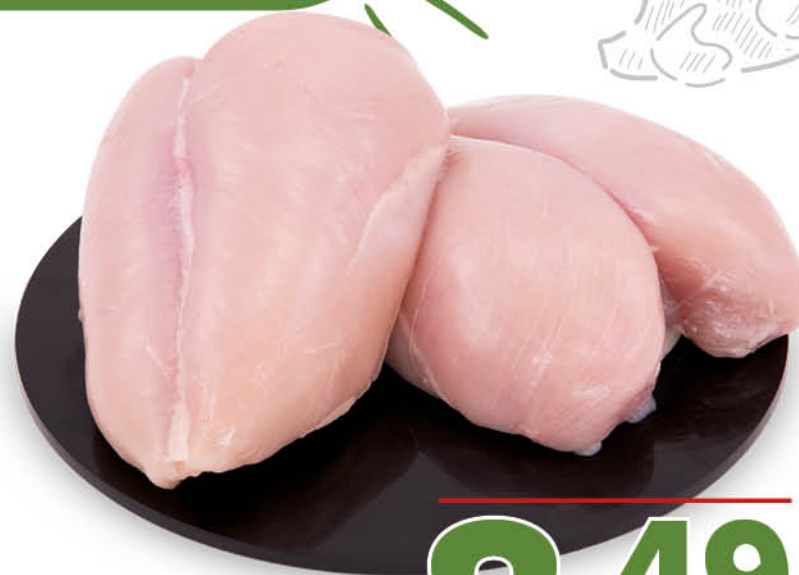
PETTO DI POLLO INTERO NEL REPARTO MACELLERIA