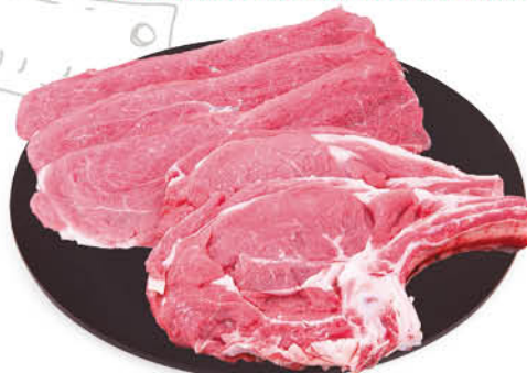
FETTINE E LOMBATINE DI VITELLO