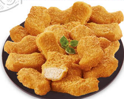
NUGGETS DI POLLO 460 g - € 9,77 al kg