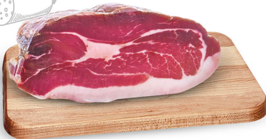
COSCIA DI SUINO BAULETTO NEL REPARTO GASTRONOMIA