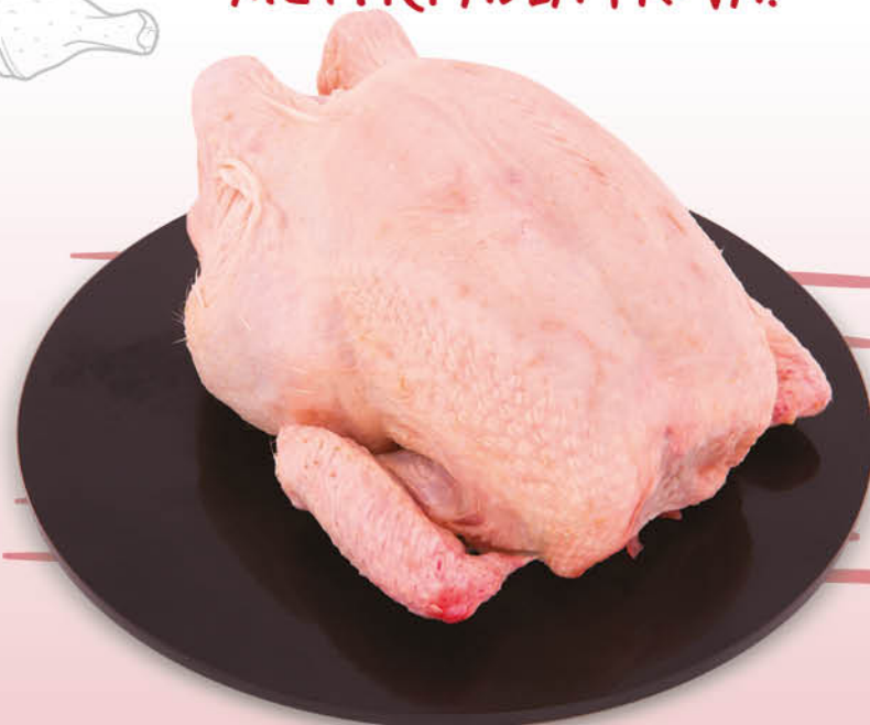
BUSTO DI POLLO INTERO