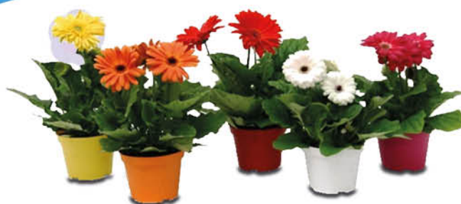
GERBERA MIX COLORI VASO 14 CM