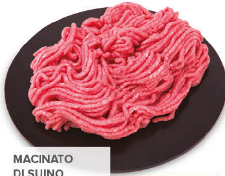
MACINATO DI SUINO SOLO PER PDV CON LAVORAZIONE REPARTO CARNI