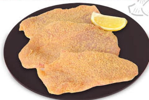
SOTTILISSIME SOTTILI COTOLETTE DI FILETTI DI POLLO 140 g - € 14,15 al kg