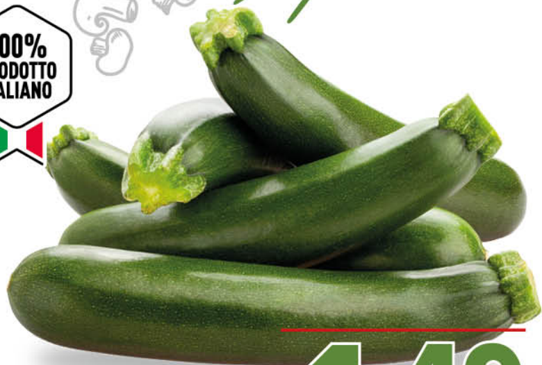
ZUCCHINE SCURE NEL REPARTO ORTOFRUTTA