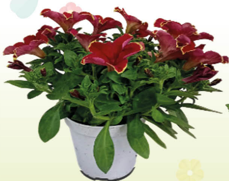
POTUNIA MIX COLORI VASO 14 CM