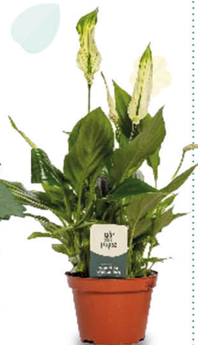
SPATHIPHYLLUM VASO 17 CM