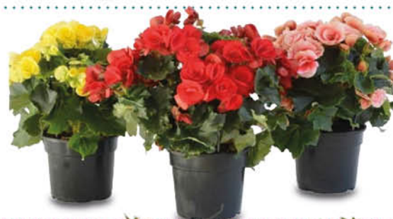
BEGONIA ELATIOR VASO 14 CM