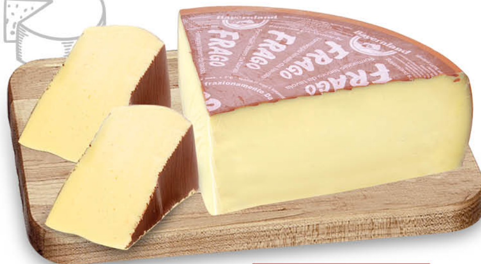
FONTAL NEL REPARTO GASTRONOMIA