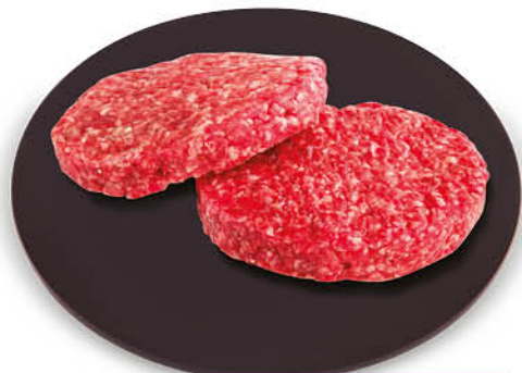
HAMBURGER DI BOVINO ADULTO