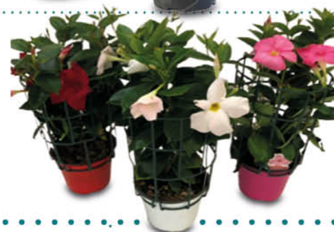
DIPLADENIA MIX COLORI VASO 14 CM