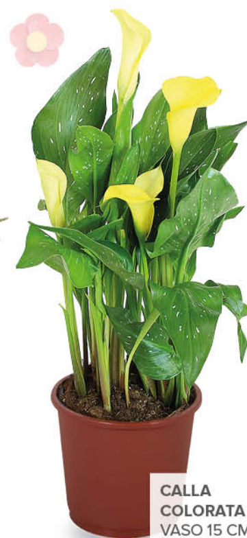
CALLA COLORATA VASO 15 CM