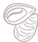
FRITTURA DI PESCE