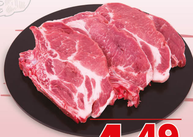
BRACIOLA DI COLLO DI SUINO CON OSSO