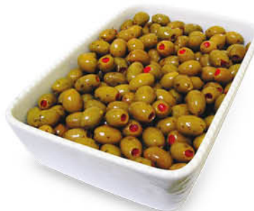
OLIVE GIGANTI FARCITE