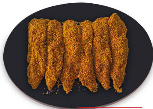
STRACCETTI DI POLLO PANATI