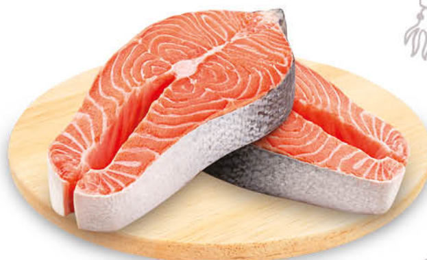
TRANCIO DI SALMONE