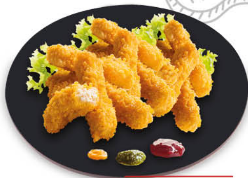
BASTONCINI DI POLLO 500 g - 6,98 al kg