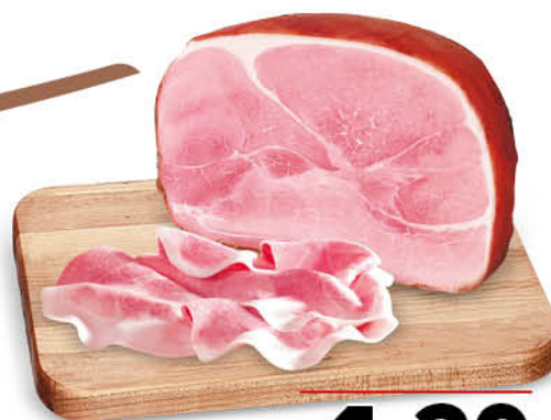
PROSCIUTTO COTTO AFFUMICATO PRAGA