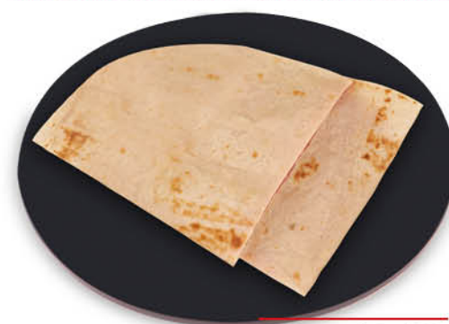
SALTIMBOCCA POLLO E TACCHINO