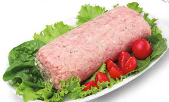
POLPETTONE DI POLLO E TACCHINO 680 g - 8,80 al kg