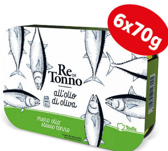
TONNO IN OLIO DI OLIVA 6x70 g € 8,79 al kg