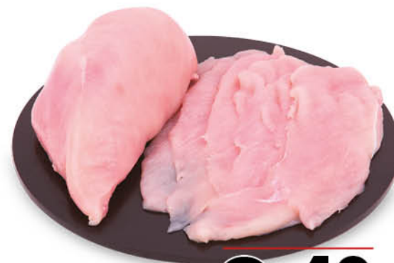
PETTO DI POLLO A FETTE