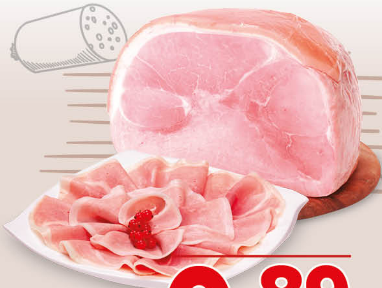
PROSCIUTTO COTTO GINEPRO