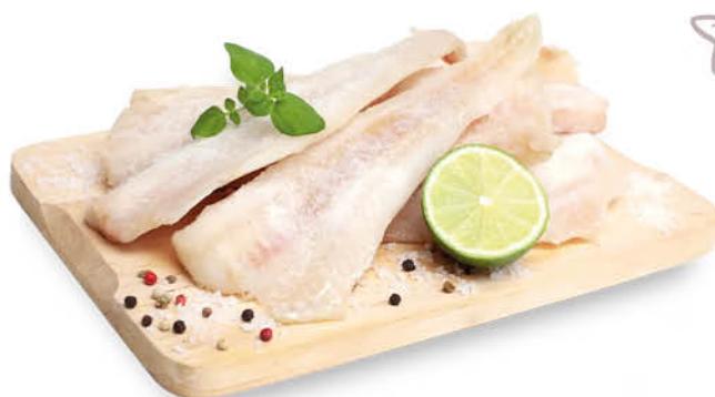
FILETTO DI BACCALÀ AMMOLLATO