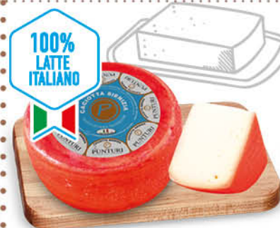
CACIOTTA MISTA SIENZIA