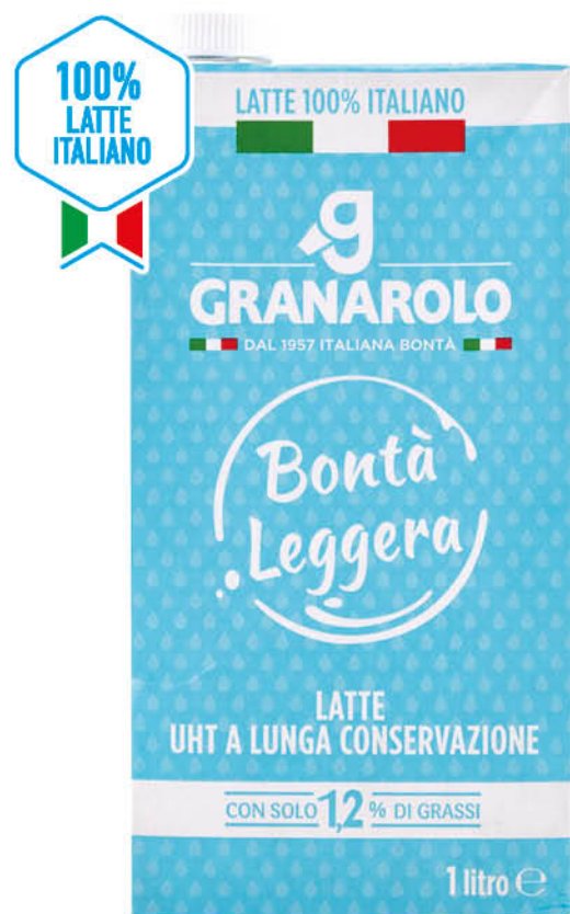
LATTE UHT GRANAROLO 1 L