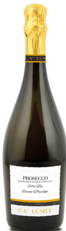
PROSECCO DOC EXTRA DRY 75 cl - € 4,40 al L 1 PEZZO € 5,90 ACQUISTO MASSIMO 9 BOTTIGLIE