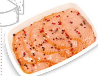
CARPACCIO DI SALMONE MARINATO