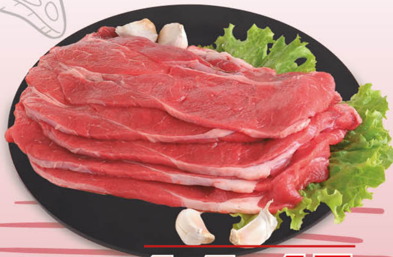
FETTINE DI REALE BOVINO ADULTO