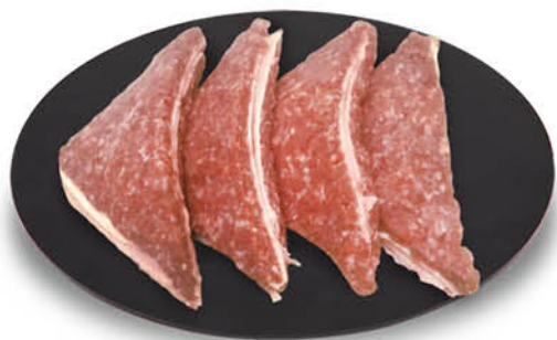
TRAMEZZINI DI SUINO 210 g - 11,86 al kg