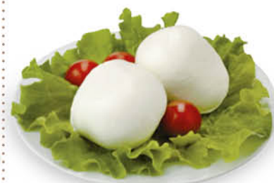
MOZZARELLA FIOR DI LATTE