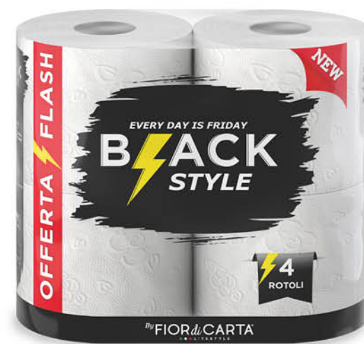
CARTA IGIENICA BLACK STYLE 2 VELI 4 ROTOLI 250 STRAPPI