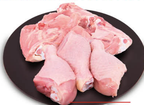
FUSI E SOVRACOSCE DI POLLO