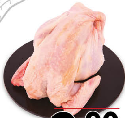
GALLINA A BUSTO