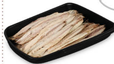
FILETTI DI SGOMBRO MARINATI