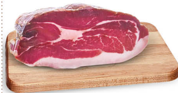
COSCIA DI SUINO BAULETTO