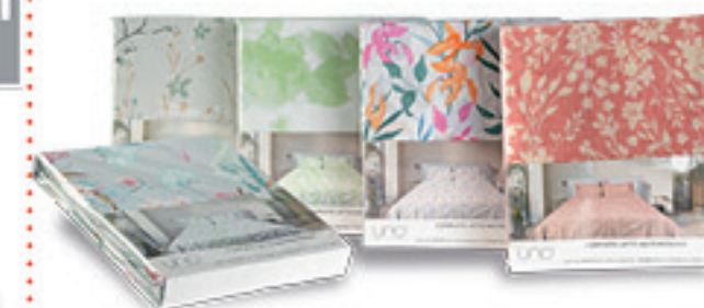
COMPLETO LETTO MATRIMONIALE ROCK