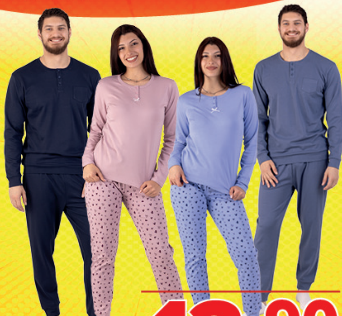
PIGIAMA INTERLOCK 220 GSM - UOMO - DONNA