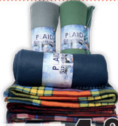
PLAID COLOMIX 125X150 TINTA UNITA/STAMPATO