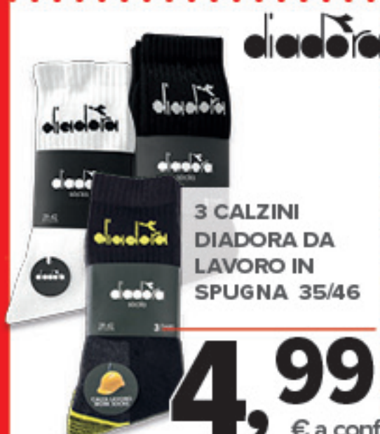
3 CALZINI DIADORA DA LAVORO IN SPUGNA 35/46