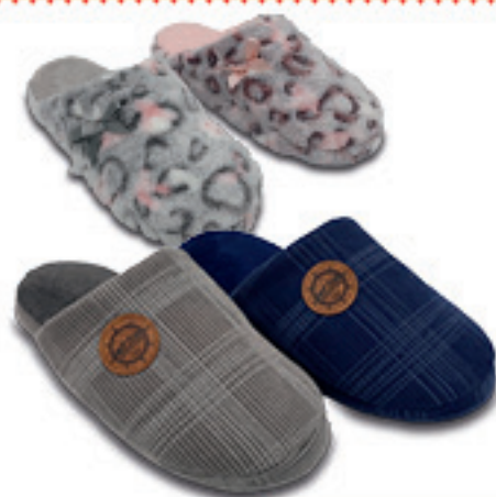
PANTOFLE - UOMO - DONNA VARIE MISURE