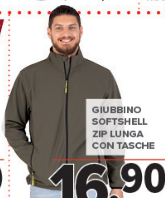
GIUBBINO SOFTSHELL ZIP LUNGA CON TASCHE